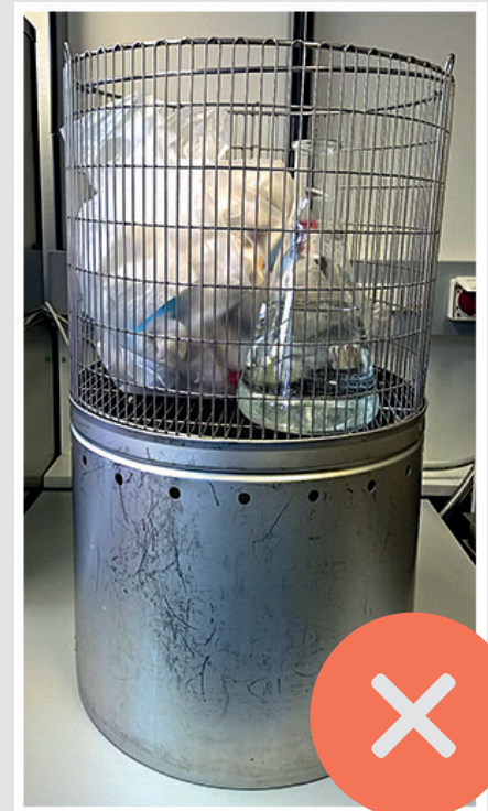
NICHT MIT FESTEM ABFALL